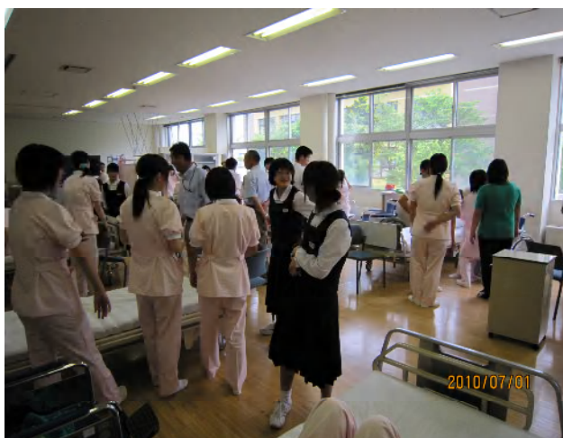
校舎案内(福祉科の実習授業)