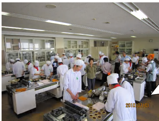
調理室でのお菓子作り

本校では、昨年まで3年間、山辺町と連携しながら「文部科学省研究開発指定 目指セスペシャリスト」を展開してきました。これを継承・発展させるべく、今年度も多くの地域連携事業を計画しています。その一つに、「地元小学校中学校の食育活動への協力」があり、早速、平成22年7月1日(木)に、山辺町立中中学校の2～3年生11名の皆さんと校長先生をはじめ6名の先生方が本校を訪問してくれ、食育を中心とした交流会を行いました。内容は、「本校食物科2年生と共同してのお菓子作り」、「食育に関するクイズ」、「校舎案内」でした。