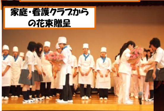
家庭・看護クラブから の花束贈呈