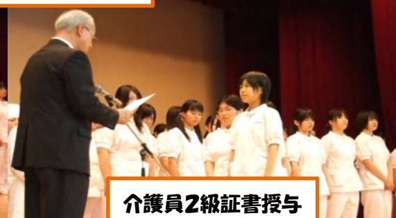
介護員2級証書授与