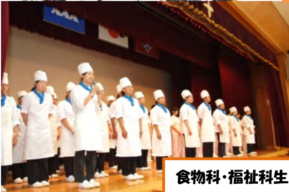
食物科・福祉科生徒代表あいさつ

食物科生徒:ホテル・レストラン・施設など 福祉科生徒:特別養護老人ホーム・ 障害者支援施設