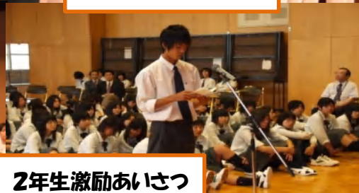
2年生激励あいさつ

激励を受けた食物科・福祉科3年生の 諸君は、6月21日(月)から約一か月に およぶ現場実習に臨みます。