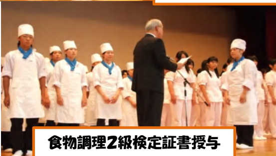
食物調理2級検定証書授与