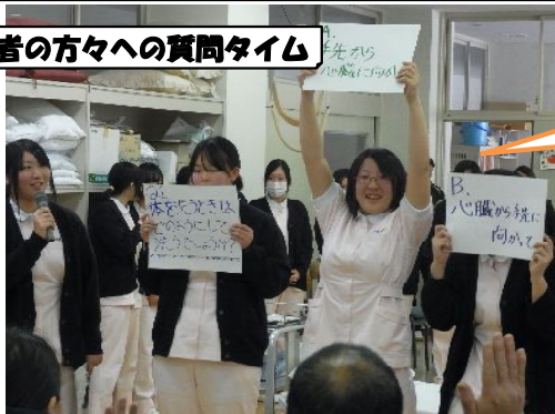
保護者の方々への質問タイム